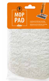
MOP PAD Panno di ricambio per LOBA Spray Mop e Mop