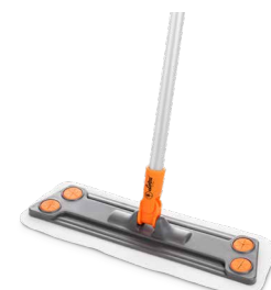
MOP Mop per l'applicazione dei prodotti per la pulizia e la manutenzione LOBA